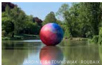
JARDIN ELSA TOMKOWIAK - ROUBAIX