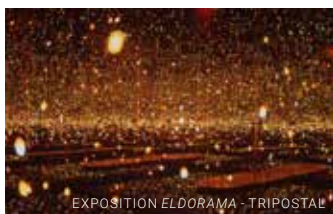
EXPOSITION ELDORAMA - TRIPOSTAL