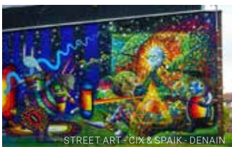
STREET ART - CIX & SPAIK - DENAIN

Kusama, Infinity Mirror Room Fireflies on the water © Yayoi Kusama / Cnap