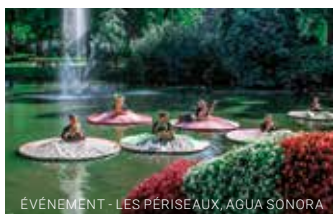
ÉVÉNEMENT - LES PÉRISÉAUX, AGUA SONORA